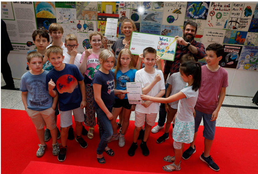
Die Schüler der evangelischen Hochschule in Wilmersdorf gewannen den Sonderpreis der B.Z.

Enthüllt wurde ihr Plakat von drei Mitgliedern der „Blue Man Group“ am Montag am Potsdamer Platz. Als Belohnung darf die Schülerin jetzt mit ihrer Klasse eine Show der Pantomime-Gruppe besuchen.