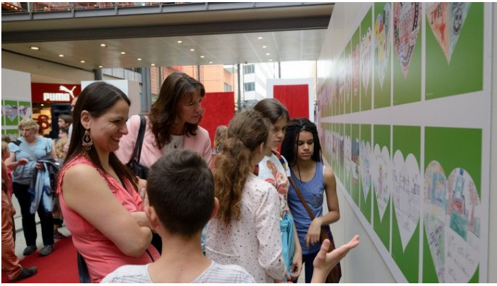
Auf einer Ausstellung werden viele der Entwürfe gezeigt.

Das Siegerbild wird auf Plakatflächen in der ganzen Stadt gezeigt. Vorher gibt es bei einer großen Preisverleihung Prämien für die Gewinner und weitere Plätze. In einer öffentlichen Ausstellung werden zudem viele der eingereichten Ideen gezeigt.