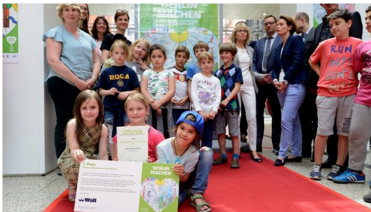
Die Gewinner 2016.

Am 05. und 06. Mai findet der 7. BERLIN MACHEN Aktionstag 2017 statt. Um dafür möglichst viele Teilnehmer zu motivieren, werden Nachwuchs-Kreativköpfe gesucht, die eine Plakatwerbung entwerfen.