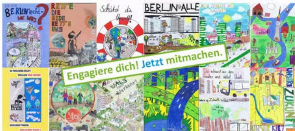
Beispielhafte Plakate aus den vergangenen Jahren

Deiner Kreativität sind keine Grenzen gesetzt: Ob gemalte, gezeichnete Bilder, Fotos oder Collagen.